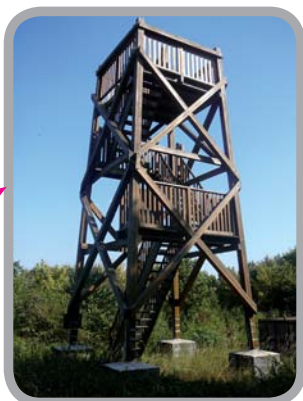
Rozhledna Strážnice 50°13'26.629"N, 17°36'19.410"E

Všechny popisované obce leží na trati Třemešná ve Slezsku – Osoblaha. Pokud bychom však chtěli cestovat pouze vlakem a autobusem, z časových důvodů a v návaznosti na odjezdy vlaků a autobusů bychom už poslední vlak z Osoblaha nestihli, v tom případě, dle svého uvážení, volíme ze dvou zastávek (Liptaň a Slezské Rudoltice) jen jednu.