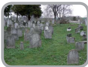
Židovský hřbitov v Osoblaze 50°16'36.00"N, 17°43'1.00"E