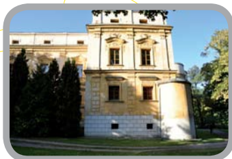
Zámek Slezské Rudoltice 50°12'20.00"N, 17°41'22.00"E