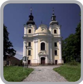
Kostel Prozřetelnosti Boží, Šenov 49°47'2.819"N, 18°22'14.069"E