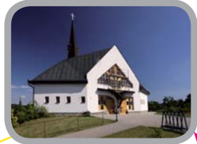
Kostel sv. Václava, Václavovice 49°45'28.846"N, 18°21'58.922"E