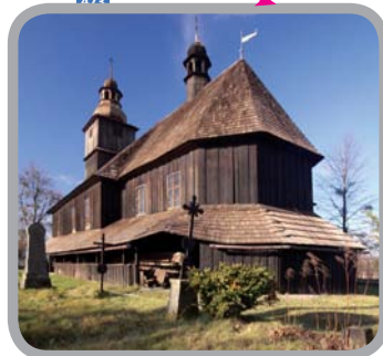
Dřevěný Kostel Všech svatých, Sedliště 49°43'6.475"N, 18°22'2.378"E