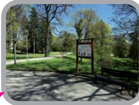
Šenovská naučná stezka - malý okruh 49°47'6.880"N, 18°22'29.758"E