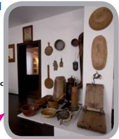
Muzeum Lašská jizba, Sedliště 49°43'7.279"N, 18°22'1.460"E