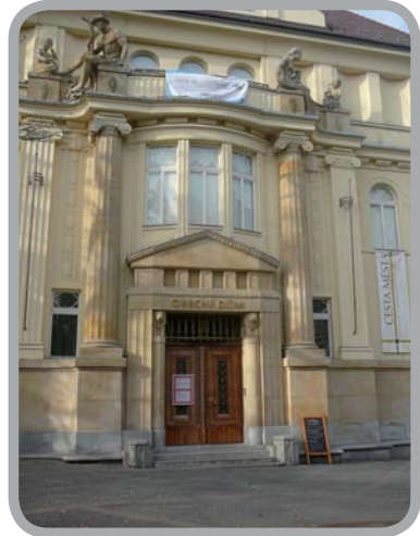
Obecní dům (muzejní expozice – Cesta města), Opava 49°56'16.724"N, 17°54'11.712"E