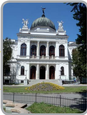
Slezské zemské muzeum, Opava 49°56'14.656"N, 17°54'29.953"E