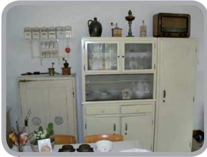
Muzeum Slezský venkov, Holasovice 49°59'58.078"N, 17°48'34.171"E