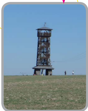
Rozhledna Šance 49°51'1.715"N, 17°54'57.340"E