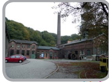
Landek park 49^{\circ}51'59.461''N, 18^{\circ}15'41.177''E