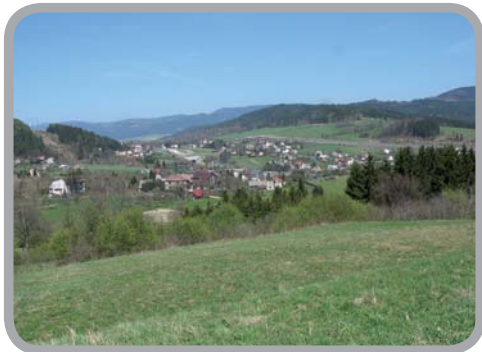
Jablunkovským průsmykem 49°30'47.615"N, 18°45'8.709"E