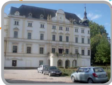
Zámek Bartošovice 49°40'16.730"N, 18°3'2.070"E