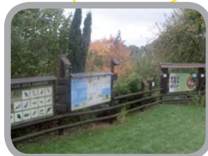
Záchraná stanice a centrum ekologické výchovy, Bartošovice 49°40'14.498"N, 18°3'11.019"E