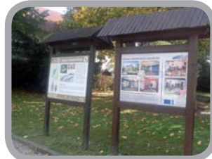
Zámecká naučná stezka 49°40'16.730"N, 18°3'2.070"E