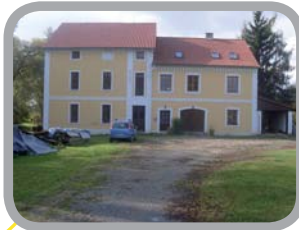
Vodní mlýn v Bartošovicích 49°41'16.152"N, 18°2'26.062"E