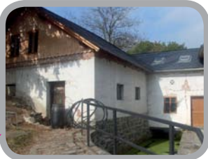
Mlýn Wesselsky, Odry-Loučka 49°41'9.312"N, 17°47'52.441"E